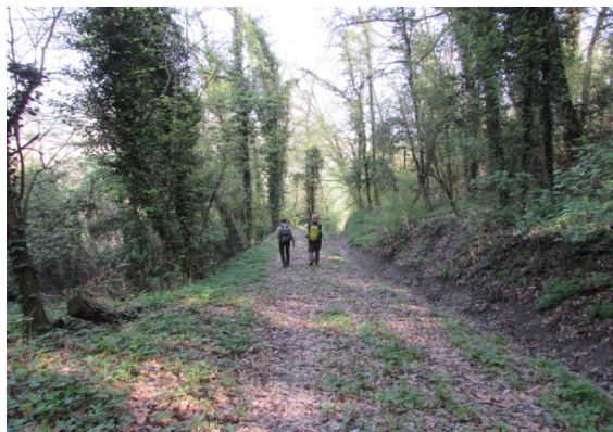
Il sentiero a Mombello